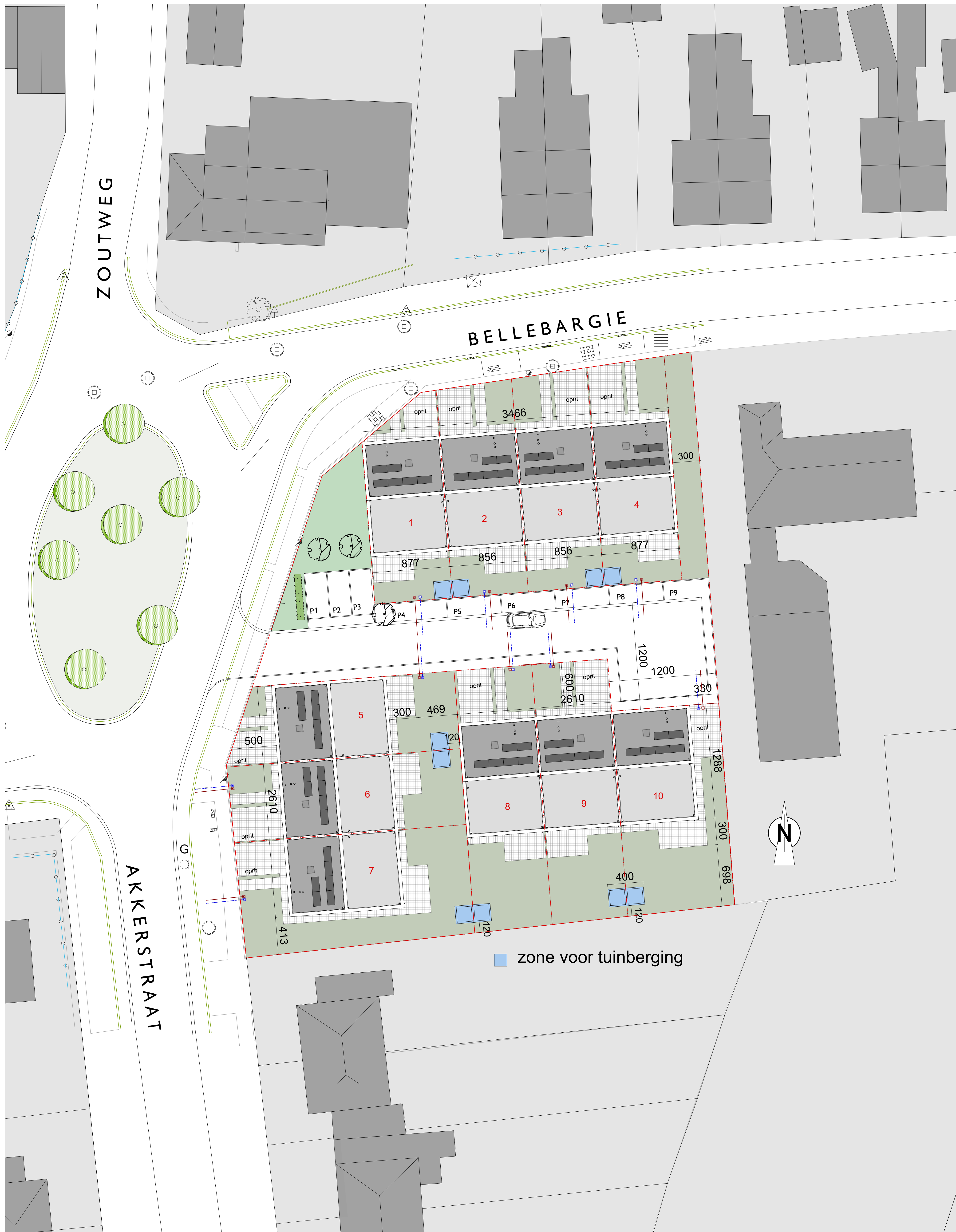
INPLANTINGSPLAN schaal 1/200

Hets al deze afbeeldingen mag zonder voorafgaande schriftelijke toestemming van de ontwerper worden openbaar gemaakt of verspreid, waaronder begrepen het kopiëren door middel van druk, offset, kliktype of microfilm, of in enige andere, elektronische, optische of andere vorm of op een andere manier, in aanvulling op het elektronisch het kopiëren (i) ten behoeve van een onderneming, organisatie of instelling of (ii) voor eigen gebruik, studie of gebruik anderszins met uitsluiting van het overnemen in enig dag-, nieuws- of weekblad of tijdschrift (al dan niet in digitale vorm of online) of in een RTV-uitzending. In voorkomend geval zal de bronvermelding steeds correct worden toegepast. In geval van mededeling aan derden van de resultaten van de intellectuele prestaties van de ontwerper zal dit schriftelijk voor de ontwerper van de documenten worden vermeld.